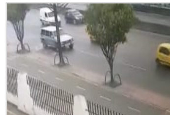
Ingreso ECSAN – Auto Sur