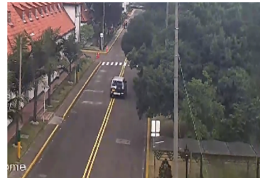
Av. Chile – Parte Interna ECSAN