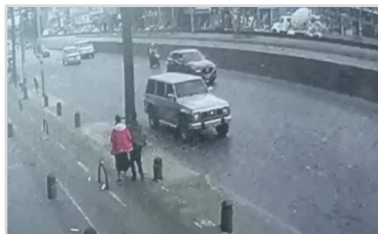
Calle 45 A No 51 D - 43