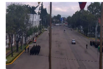
Av. Del trabajo – Parte interna